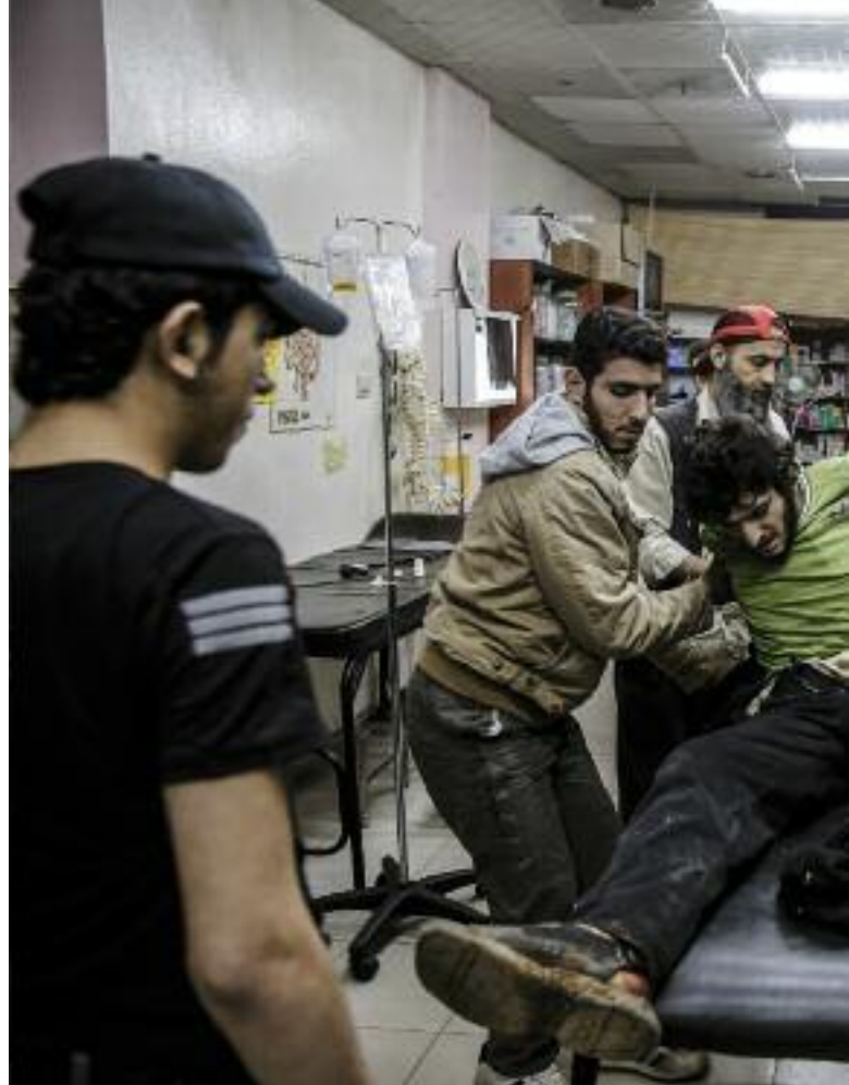
Das Wichtigste ist, nicht aufzugeben. Ein Verletzter wird in der Notfallstation des