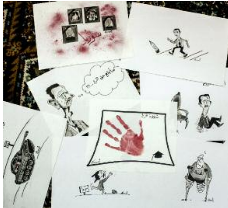
Lachen über Assad. Karikaturen gehören in jede Ausgabe der Zeitung.