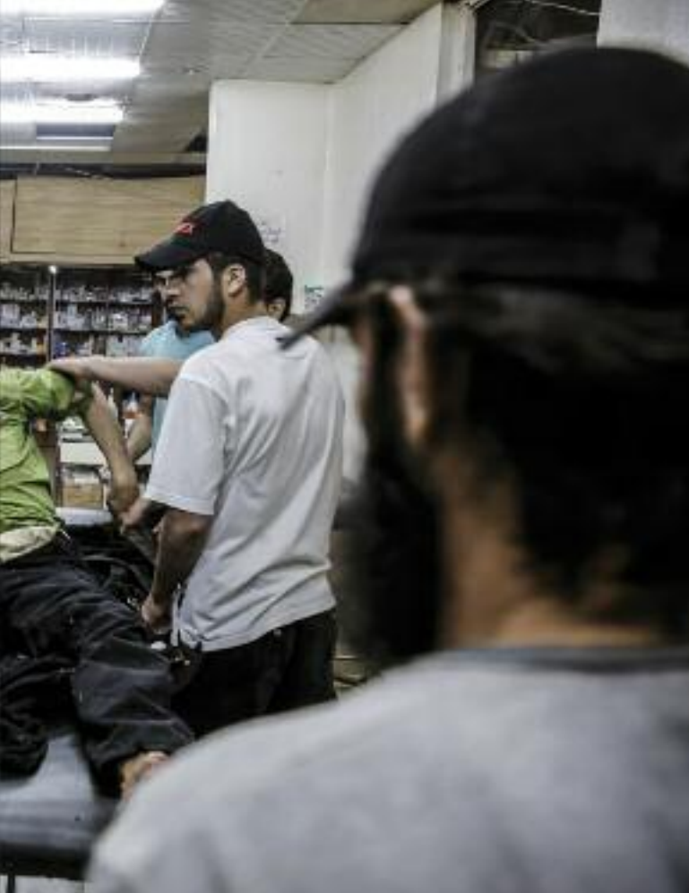
einzigem Krankenhaus der Stadt behandelt.