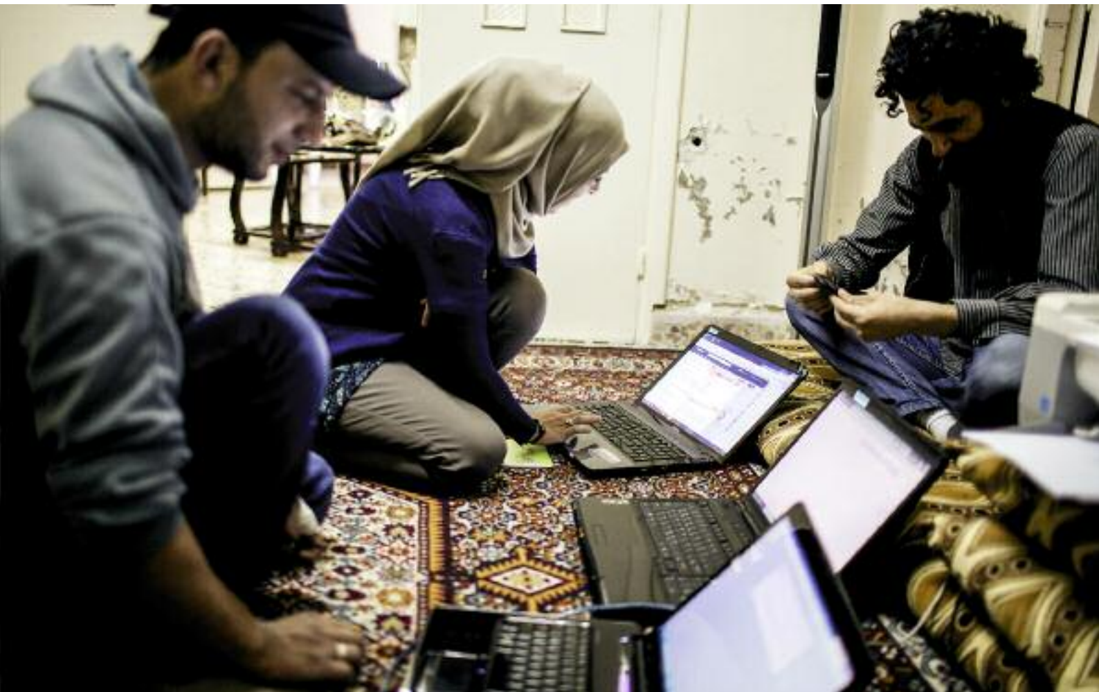
Traum von einer freien Presse. Reporter und Redakteure von »Oxygen« planen die nächste Ausgabe.