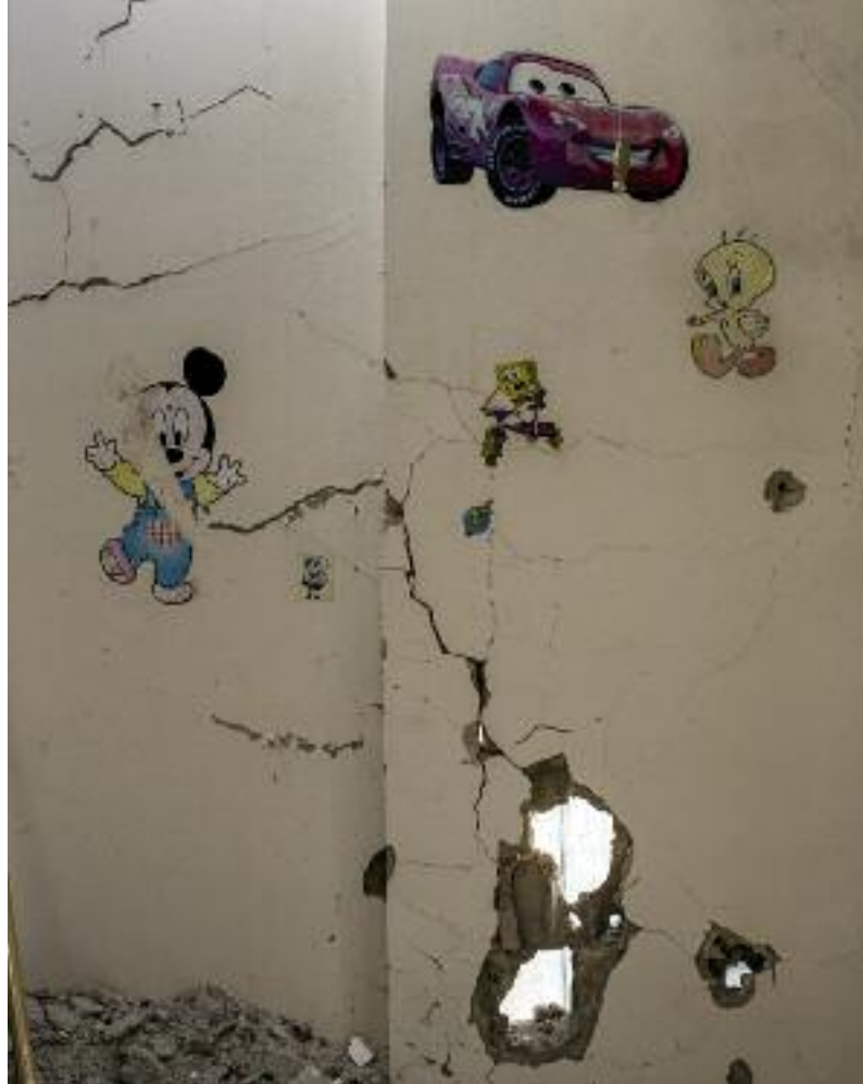
Leben in Trümmern. Kinderzimmer in Zabadani.