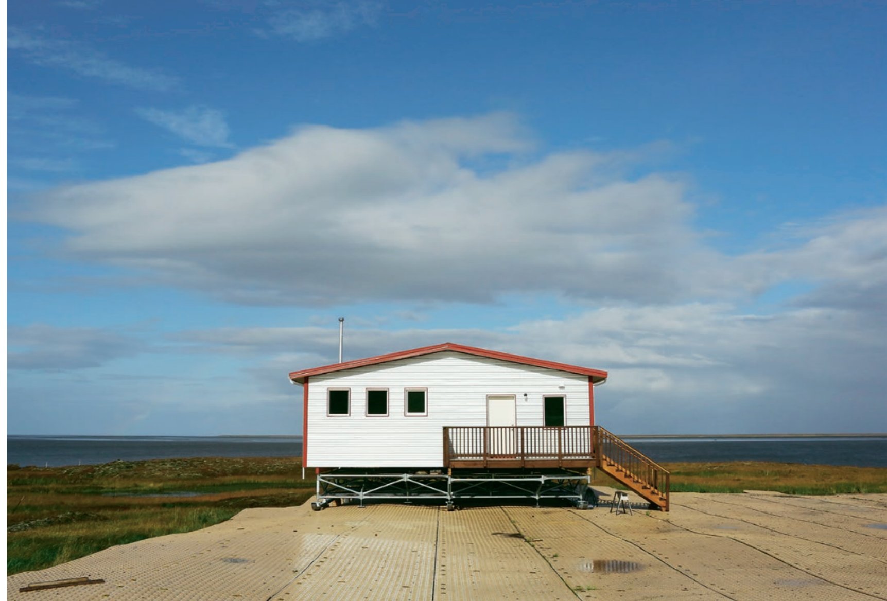
Auf der anderen Seite des Flusses stehen die ersten Häuser des neuen Ortes, hoch und trocken und seit Jahren leer. Weitere Häuser sind geplant, aber es geht nicht voran