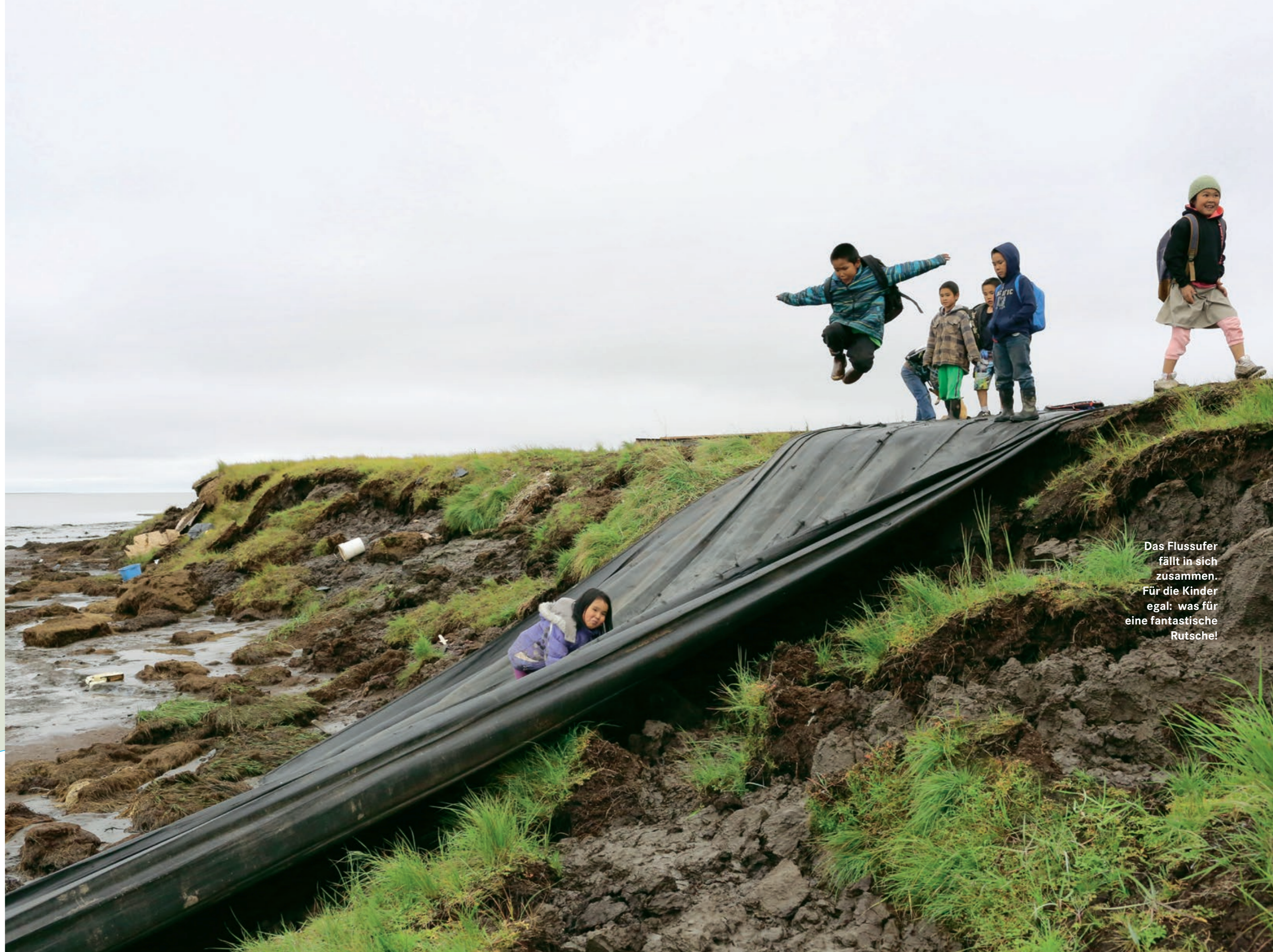
Das Flussufer fällt in sich zusammen. Für die Kinder egal: was für eine fantastische Rutsche!