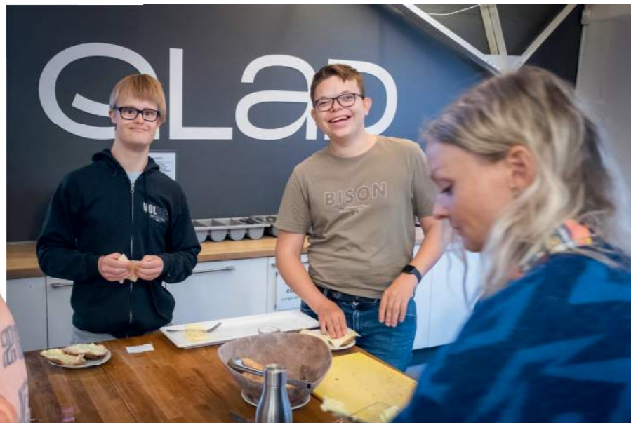
In der Kantine gibt es jeden Tag frisch gebackene Brötchen – nach der Morgengymnastik.