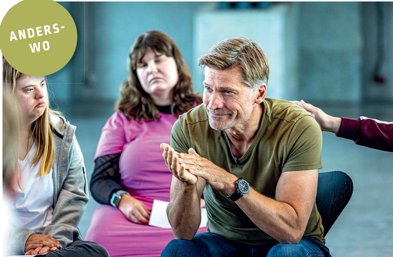
Trost für einen Star: Schauspieler Coster-Waldau erzählt von seiner Kindheit.