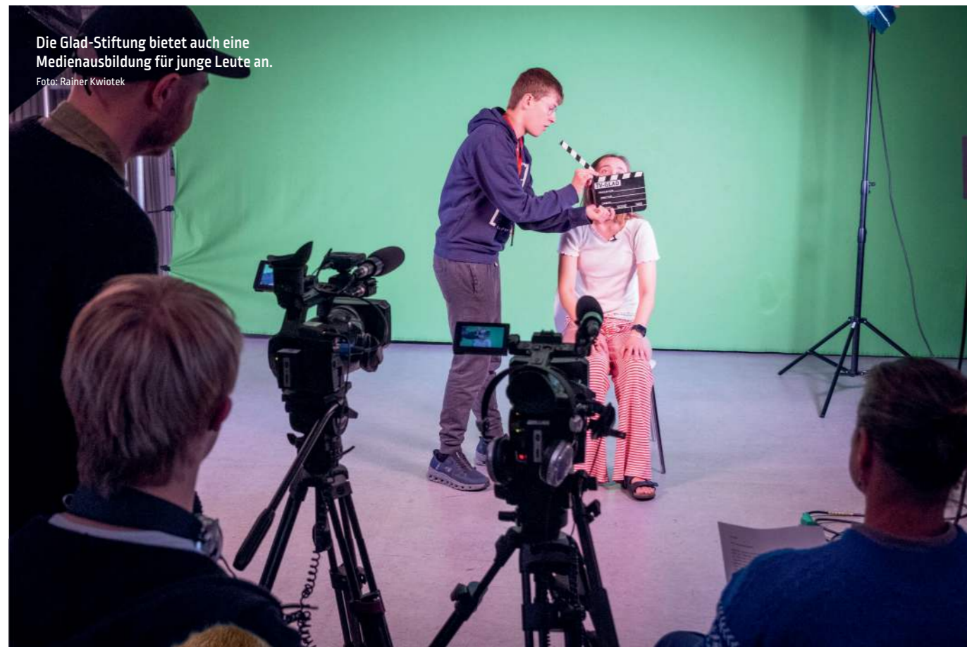
Die Glad-Stiftung bietet auch eine Medienausbildung für junge Leute an.